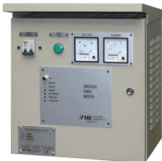
Inverter Circuit Circuitazione Inverter